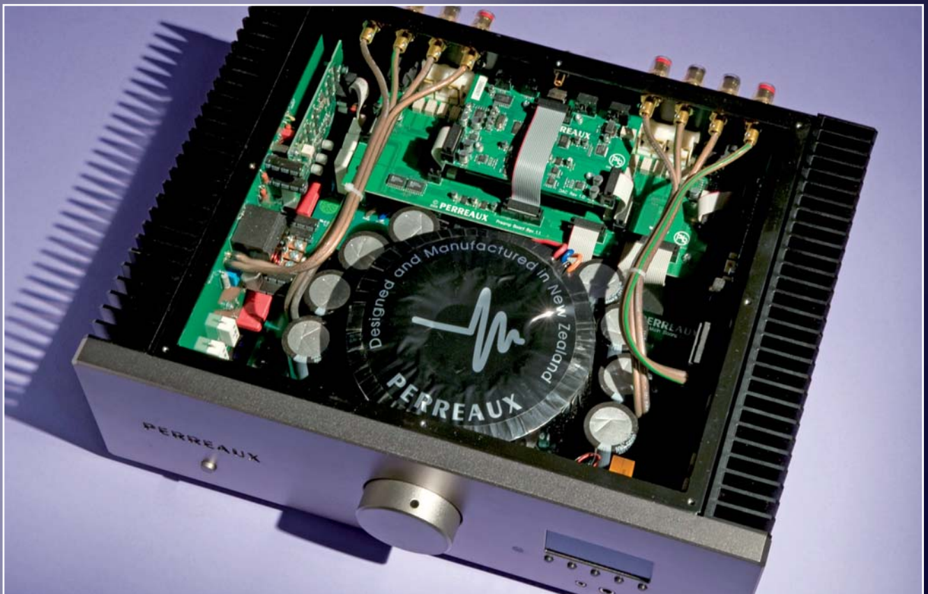
L'alimentation prend pratiquement toute la place du châssis, comme en témoigne le transfo central. les étages de puissance sont collés aux flancs.