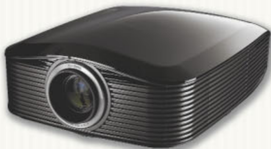
Projecteur DLP 1080p HD82 d'Optoma