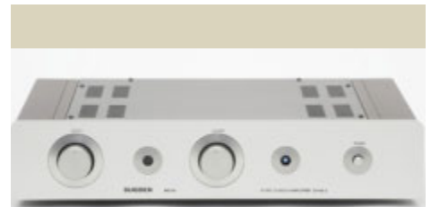
Sugden A21A Serie 2