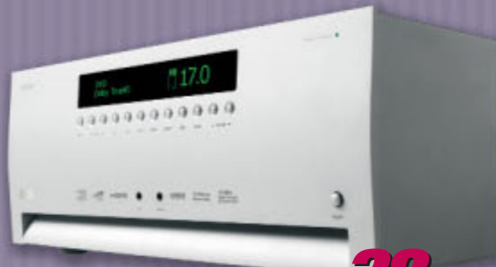
Récepteur audio-visuel FMJ AVR 600 d'Arcam

8 Tendances électroniques ou comment allier ambiance et sonorité chaleureuses Intégration de Fillion Électronique